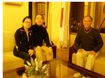
重慶日本駐在総領事と会談