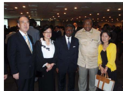
アフリカ駐東京34か国パーティー